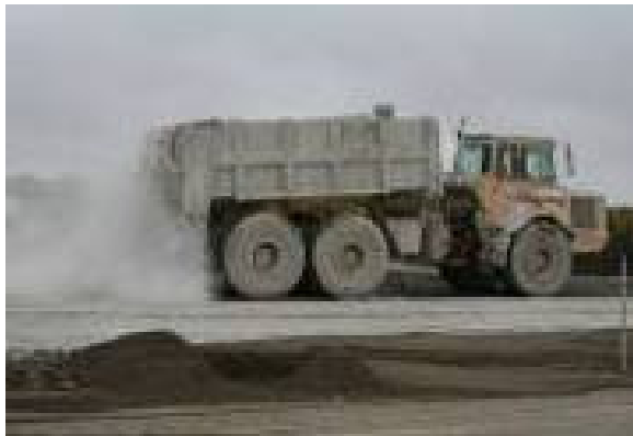
Figur 5. CM20/80 läggs ut.

När stabiliseringen uppnått önskad hållfasthet kunde ett slitlager av asfalt påföras.