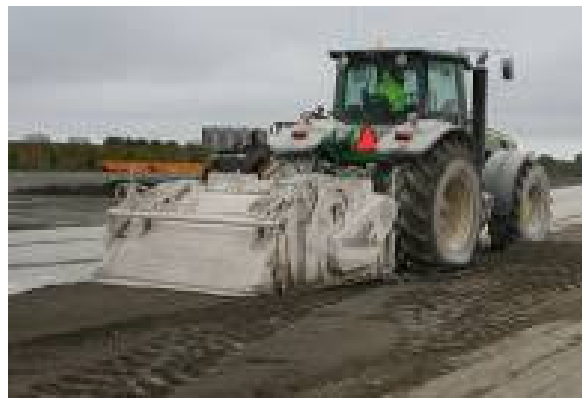
Figur 6. Bindemedlet fräses ner i krossgruset.